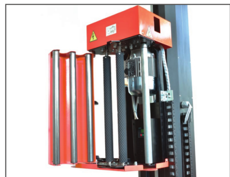
I ALTERNATIVET: PPS-VAGN

Försträcknings aggregat; 1650 mm platta; Ramverk för nedsänkning i golv; Ramp.