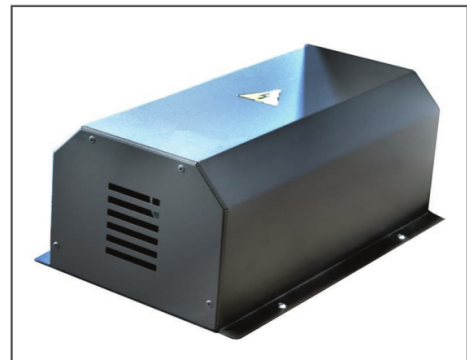
LOCK FÖR ROTATIONSMOTOR